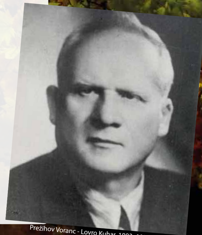
Prežihov Voranc - Lovro Kuhar, 1893–1950

HERBST REIHE HÄCKEL-SLOVENSKA ŠTUDIJSKA KNJIŽNICA SLOVENSKEGA PROSVETNEGA ZVEZA DRUŠTVO SLOVENSKEGA PISATELJEVA ZVEZA STRUHAČEKSTUDIJSKA JES ENSKI NIZ HAČEK BÜCHER • SPRACHEN • KULTUREN KNJIGE • JEZIKI • KULTURE